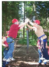
Vater und Mutter – ein starkes Team