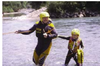
wenn der Vater mit dem Sohne...