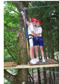
Zusammenhalten in der Höhe – die Kids alleine unterwegs